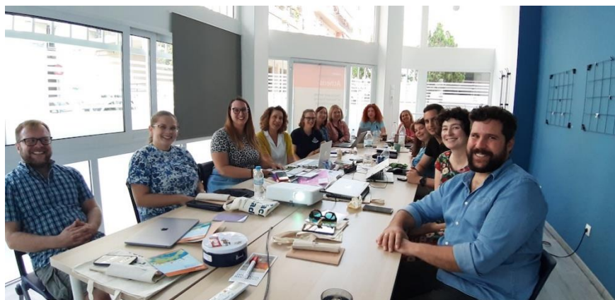
Gli insegnanti a scuola per imparare il GBL

Un corso di aggiornamento Erasmus ad Atene, dal 9 al 13 ottobre 2023, per avvicinarsi alle nuove generazioni, alle loro modalità di approccio al reale spesso mediato dal virtuale. "Video Games in Education: Innovative Gamification and Game- Based Learning Techniques" è stata una bella esperienza di incontro e scambio con colleghi europei (da Germania, Austria, Ungheria, Bulgaria, Polonia, Cipro, Italia e Croazia) di gradi scolastici e discipline diverse, uniti dalla curiosità per le potenzialità delle tecniche innovative. Abbiamo ascoltato, provato a mettere in pratica sia come docenti – creando materiali fruibili dai nostri studenti - sia come studenti – giocando con materiali già predisposti per noi discenti. "Teachers are the real influencers" è il motto scritto sulla borsa riutilizzabile in tessuto regalataci dagli organizzatori. Possiamo sperare che almeno qualcosa di quanto cerchiamo di passare ai nostri alunni lasci un segno nella loro formazione?