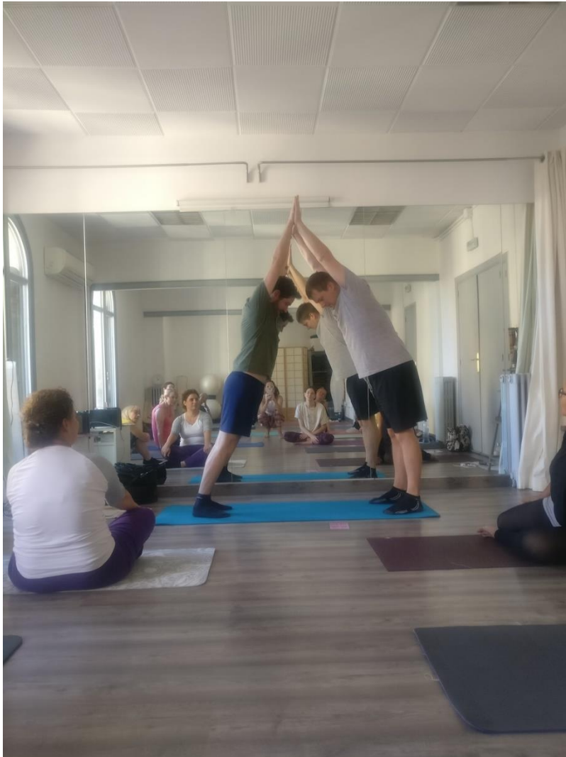
"Yoga and Meditation for Educators:

be a Great Teacher, be your Best Self" presso la Rambla de Catalunya di Barcellona, Spagna.